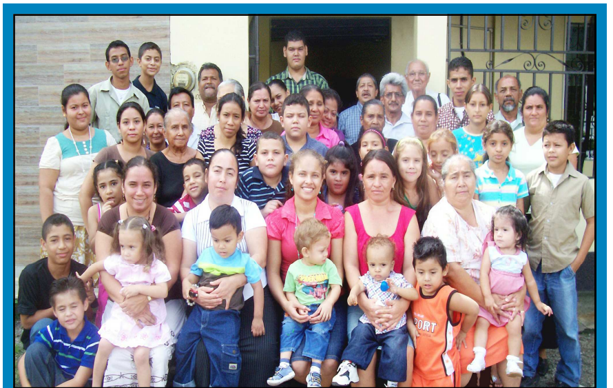
Miembros de la iglesia de Cristo de La Ideal, San Pedro Sula, Honduras.